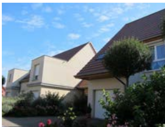
Photo : Des maisons en individuels groupés à Châtenois