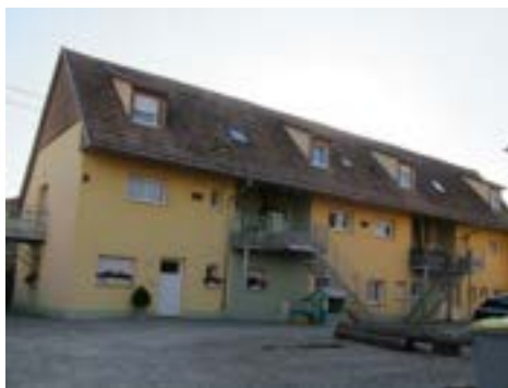
Photo : Un corps de ferme réhabilité en collectif à Artolsheim (CCRM)

L'intermédiaire selon le SCoT se définit ainsi ; toutes formes d'Habitat individuel autre que individuel pur : maisons accolées, maisons jumelées, maisons de ville.