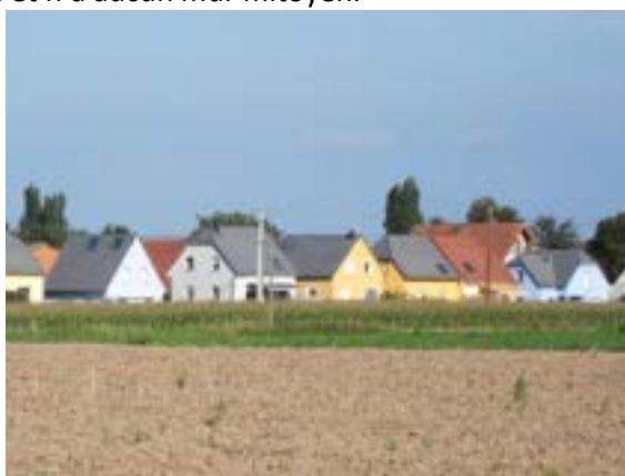
Photo : Des maisons en individuel pur à Ebersheim